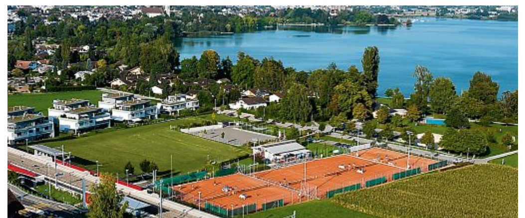
Hünenberg See ist ein fantastisches Naherholungsgebiet.