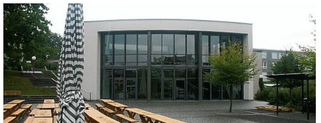
Im Saal Heinrich von Hünenberg werden viele Feste gefeiert.